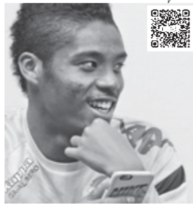
神川町公式LINEを登録 今年の成人式の様子(動画)を見て大喜び!!