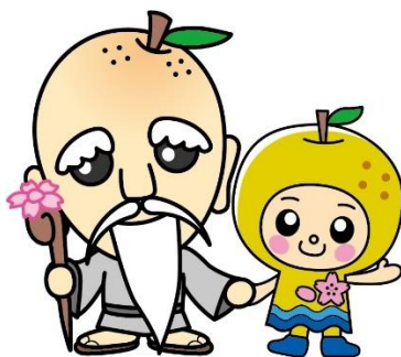
神川町マスコットキャラクター 「神じい」と「なっちゃん」