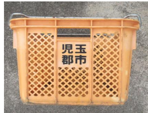
Recipiente de coleta de garrafa de vidro (recipiente de coleta laranja)