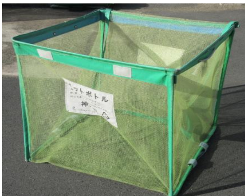
Recipiente de coleta de garrafa PET (recipiente de coleta dobrável verde)