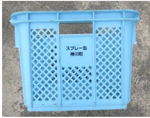
Recipiente de coleta de lata de spray (recipiente de coleta azul)

Verifique se não está descartando produtos que podem ser reutilizados, como garrafa de vidro, garrafa PET, latas de bebidas e latas de spray, como lixos combustíveis ou não combustíveis. Uma vez misturados, serão apenas lixos, porém, caso descarte como lixos recicláveis, serão utilizados eficazmente como recursos. Contamos com a sua cooperação.