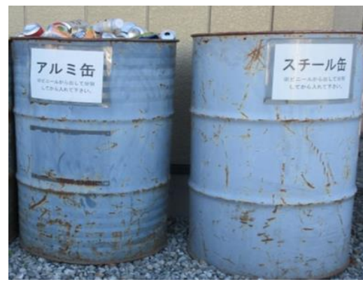
Serviços de reciclagem do bairro

Encontra-se instalado permanentemente na entrada oeste da Câmara Municipal de Kamikawa, no Centro Fureai, no salão de reuniões comunitárias norte, e na filial geral de Shinsen.