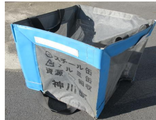
Recipiente de coleta de latas de bebidas (recipiente de coleta dobrável azul)