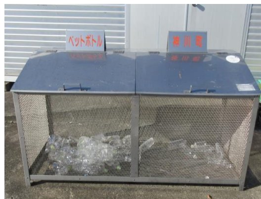
Base do local de coleta de garrafas PET

Encontra-se instalado permanentemente na entrada oeste da Câmara Municipal de Kamikawa, no Centro Fureai, no salão de reuniões comunitárias norte, e na filial geral de Shinsen.