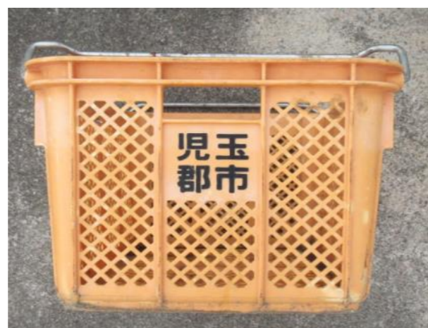
びん類回収容器(オレンジ色回収容器)