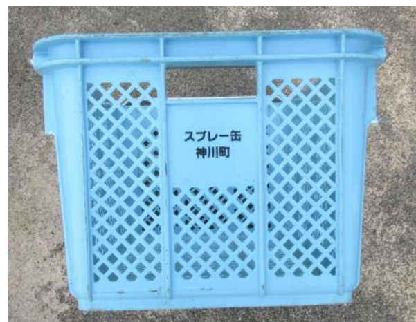
スプレー缶回収容器(青色回収容器)

資源ごみ収集場所に、下記の写真のような回収容器が収集日に設置されます。 資源として再利用できる、びん類、ペットボトル、飲料缶、スプレー缶を可燃ごみや不燃ごみで出していないですか？混ぜてしまえば単なるごみですが、資源ごみとして排出することで、資源の有効利用につながります。ご協力をお願いします。