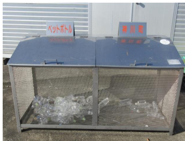
ペットボトル拠点回収場所

神川町役場西入口、ふれあいセンター、コミュニティ集会所北、神泉総合支所に常設で設置されています。