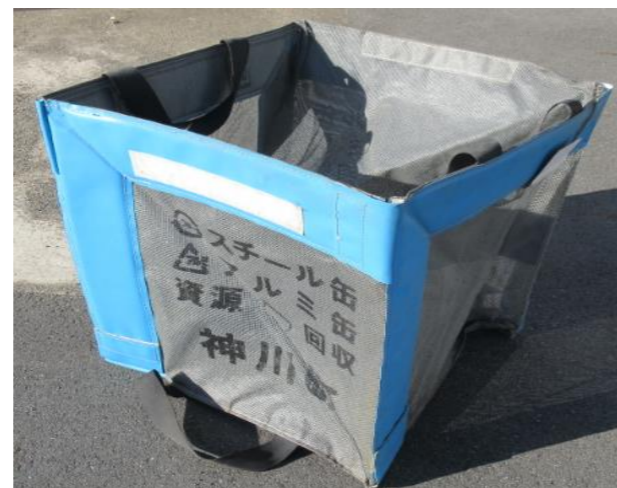
飲料缶回収容器(青色折りたたみ式回収容器)