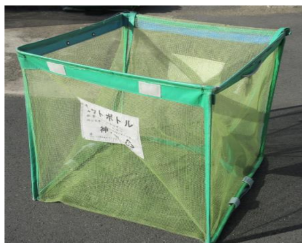
ペットボトル回収容器(緑色折りたたみ式回収容器)