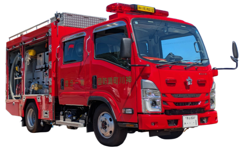
可搬ポンプ積載車