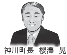
神川町長 櫻澤 晃

デマンド型乗合交通は今年度からさらにパワーアップし、利用しやすくなっています。すでに町のホームページやまちづくり通信等でもお知らせしておりますが、主な変更点は次のとおりです。