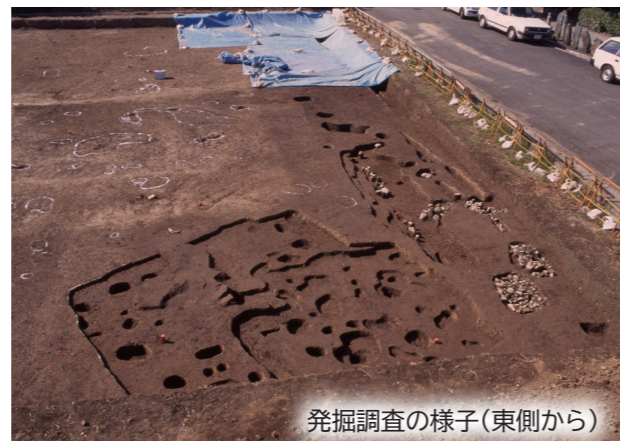
発掘調査の様子(東側から)