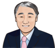
神川町長 櫻澤 晃