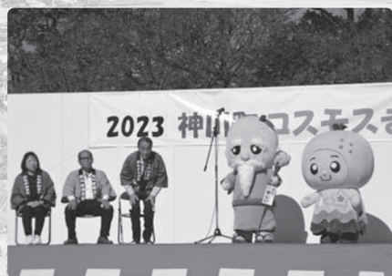
コスモスまつり・産業祭