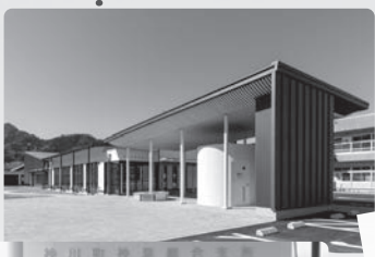
神泉総合支所開所式