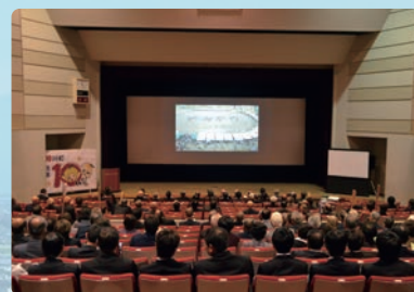
合併10周年記念式典