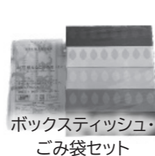
ボックスティッシュ・ ゴミ袋セット

このポイントカードで30ポイント貯めるとプレゼントがもらえます。 左のマークに書かれた数字が、もらえるポイントです。 (例)左の場合、5ポイント