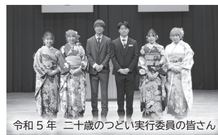
令和5年 二十歳のつどい実行委員の皆さん