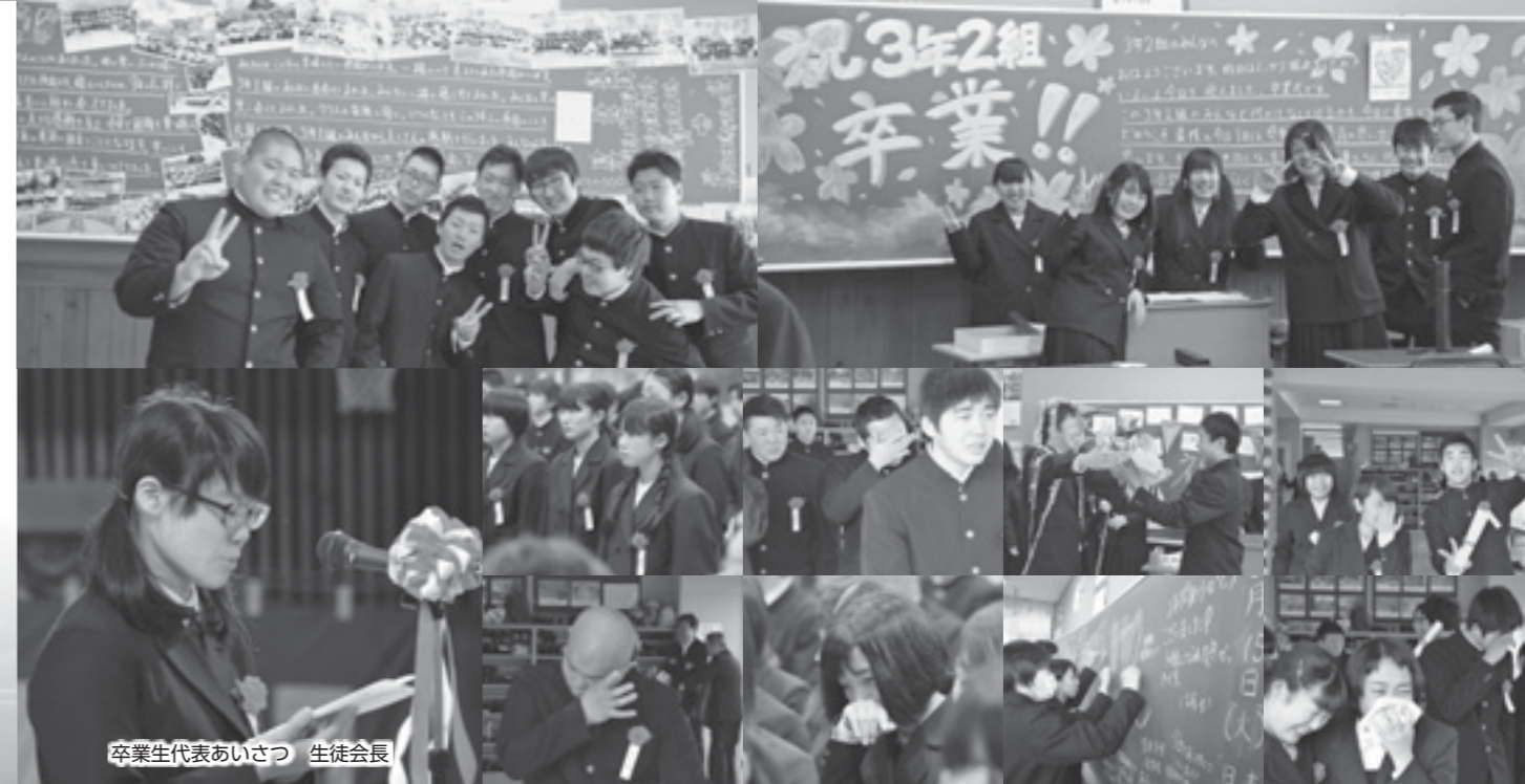
卒業生代表あいさつ 生徒会長

春がすぐそこまで近づいてきた3月15日(火)、神川中学校で卒業式が行われ、137人の生徒が卒業証書を授与されました。生徒たちは過ごした3年間を振り返り、目に涙を浮かべていました。 3年前の入学式は出来たばかりの新しい体育館が皆さんを迎えてくれました。 1年生の夏には特別教室棟の建替工事が始まり、騒音や教室の制約など、1年以上不便な思いをさせてしまいました。 エアコン設備や駐車場整備、グラウンド整備と、めまぐるしく変わる環境の中でも、学業や運動に充実した学生生活を過ごす、とてもたくましい年代だったそうです。 これまでも行政、議会が一丸となり教育環境の充実に力を注ぎ、子供たちのためになる施策を実施してまいりました。 神川中学校で学んだ様々なことをこれからの生活に活かし、目標に向かって頑張ってください。 神川町は全力で皆さんを応援します。 ご卒業おめでとうございます。