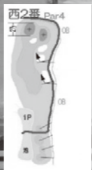
協力：埼玉国際ゴルフ倶楽部（下阿久原）