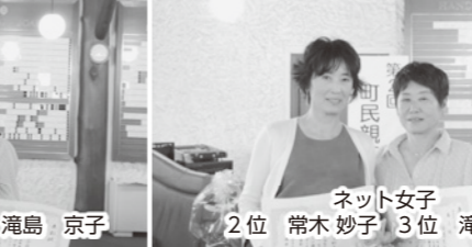
早朝スタートされた方々