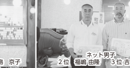
早いグリーンに戸惑いも