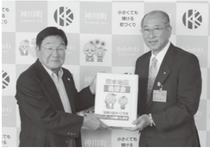
熊本地震義援金 参加者から義援金の寄付がありました。ありがとうございます。

5月9日（月）埼玉国際ゴルフ倶楽部（下阿久原）にて第2回町民親睦ゴルフ大会が開催されました。 当日は曇り空で雨の心配もありましたが、無事大会を終えることができました。 町内在住者や町の関係者総勢159人、若手から高齢の方までが参加しました。日々の練習の成果を発揮できた方やそうでない方、久しぶりにコースに出た方、新たにゴルフ仲間ができた方。青々とした芝生の上でゴルフを通して親睦を深めました。町では生涯楽しめるスポーツを通じた健康づくりを推進しています。