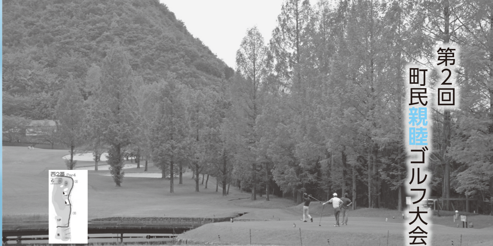
敬称略にての掲載にご容赦ください