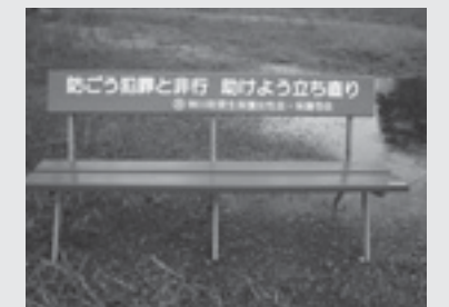
元阿保公会堂に設置