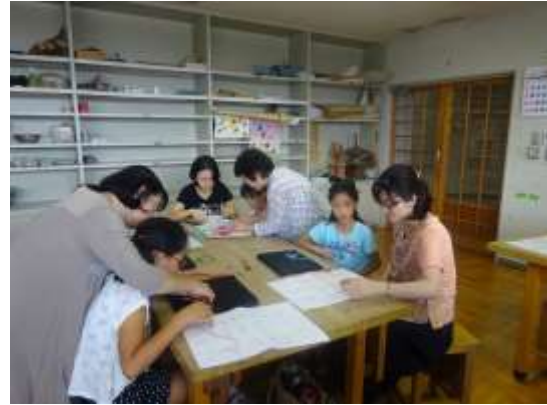
週末子ども教室 「とんぼのブローチ作り」