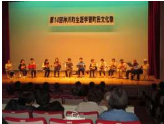
生涯学習 町民文化祭

県や近隣市町村等と連携しながら、文化に関する活動や施設等の情報提供を充実させます。