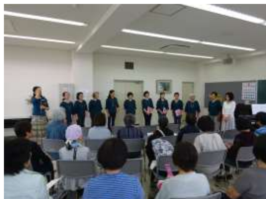
コスモスハーモニー主催 【ハーモニーの広場】