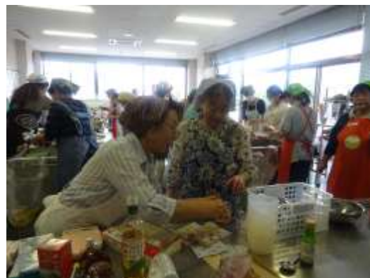
一般講座「梨のデザート作り」