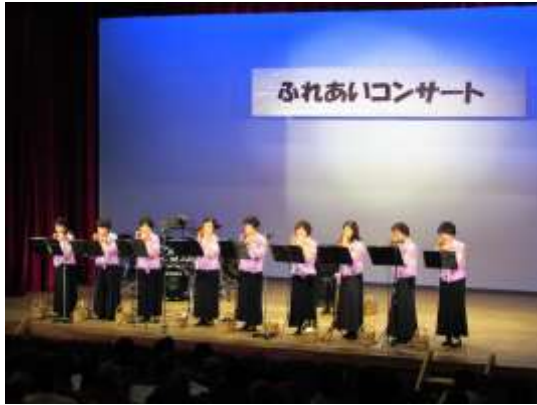
神川企画舎主催 「ふれあいコンサート」