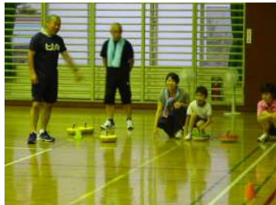
フロアカーリング教室