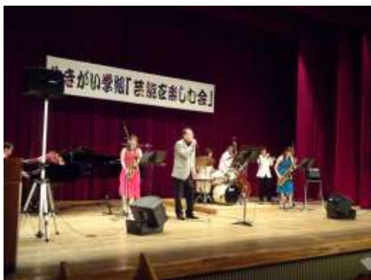
高齢者生きがい学級「芸能を楽しむ会」