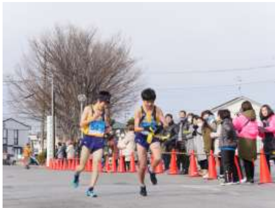
かみかわ駅伝大会