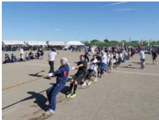
生涯学習町民体育祭

体育協会加盟団体をはじめ、スポーツ少年団及び自主活動を行っている団体等の事業の活性化を支援します。