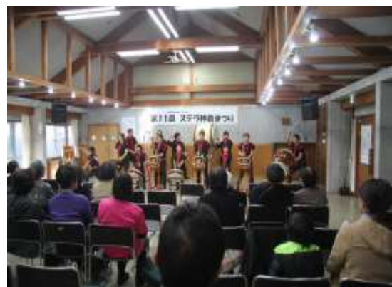
ステラ神泉まつり