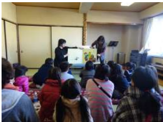
週末子ども教室「わくわくタイム」

学校開放施設としての体育館は神川中学校をはじめ丹荘・青柳・渡瀬・神泉各小学校にあり、神川中学校には柔剣道場が設置されています。グラウンドは全小中学校にあります。ナイター照明が整備されているのは中学校と丹荘・渡瀬小学校となっています。今後とも、より一層施設の有効利用を進めるとともに、利用者マネーの徹底を図りながら、広報やホームページを使いPR活動を行います。