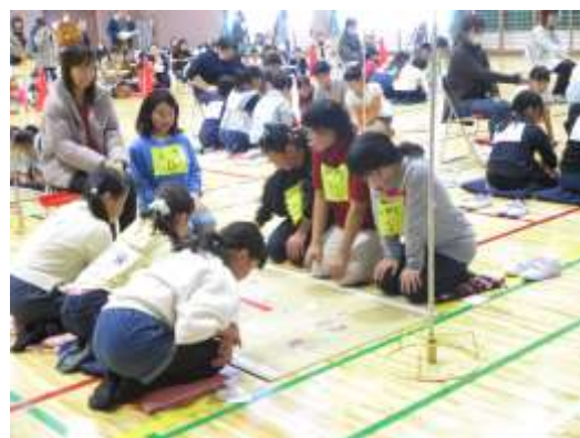
子ども会育成会事業「郷土かるた大会」