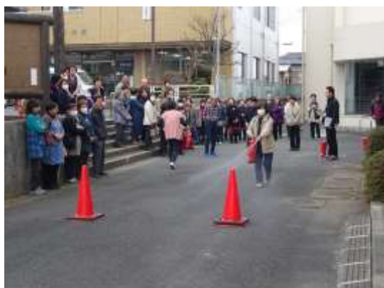
中央公民館 消防訓練