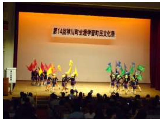
神川幼稚園 町民文化祭舞台発表