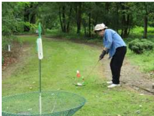
ターゲットバードゴルフ場

高齢者の多い地域では、身近でできる軽スポーツの普及を図るため、職員やボランティアが集会所等に出向く出前教室を開催します。