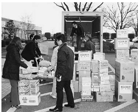
東北地方救援物資積込作業

次に、避難場所の確認、家庭内で備えるべき備品、心構え等については、土砂災害及び洪水関係のハザードマップを町内に全戸配布しました。この中には土砂災害警戒区域や洪水による浸水被害が予想される区域を表示するとともに、災害時に避難する際の注意事項や非常持ち出し品等わかりやすく表現しています。また、4月1日からは全国的な取り組みとして、緊急地震速報や噴火情報などの緊急通信を町防災無線で即時に放送できる全国即時警報システムの運用を開始されます。最近の災害は以前にも増して多様化する傾向があり、住民の皆様が災害に備えるための情報を引き続き広報、町ホームページ等を積極的に利用し、お知らせしていきたいと思っております。