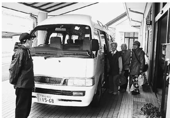
総合福祉センター事業送迎

町内循環バスにつきましては、その実現に向けて検討していますが、多くの自治体でコミュニティバスを導入されましたが、利用者が少なく、費用に見合った効果が上がっていないことや、高齢者や障害者など自分でバス停まで行くことができない交通弱者の対応等が問題となっています。町でも先進的な市町村の情報を収集し、運行の効率と乗客の利便性を考慮した効果的な移動方法を検討し、高齢者や障害者などの交通弱者のニーズにこたえるため、今後町民の主要な交通手段である既存の路線バスの存続とあわせ、高齢者、障害者等の交通弱者の移動手段を確保するため、コミュニティバス、デマンドバス等の運行について検討してまいりたいと考えております。