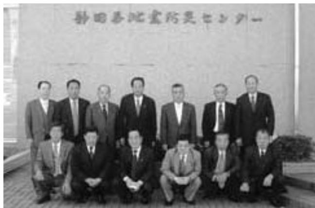
静岡県地震防災センター

また、静岡県地震防災センター視察では、所長から詳細説明を受け、地震防災に対する更なる意識高揚と防災対策の一層の推進が必要である事など有意義な研修を行いました。