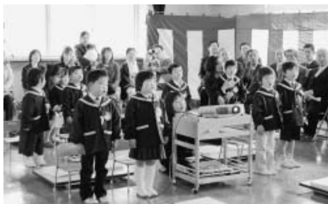
いずみ幼稚園 卒園式

いずみ幼稚園保護者説明会は3回、神泉地区地域説明会は2回、いずみ幼稚園保護者対象の神川幼稚園入園説明会を2回、それぞれ実施してまいりました。これまでの説明会を通じていずみ幼稚園に対する大切な思いや急過ぎる統合という声等、皆様の不安を強く感じてまいりました。さらに、不安を増幅させることとして、入園許可通知の件がございませぬ。この入園許可通知の手続において不備がございましたことや幼稚園の保護者の皆様にご迷惑をおかけいたしましたことと対応してまいりました。保護者の不安でもある就園先の相談を1月に3日間、すべての保護者を対象に個別の就園相談を実施してまいりました。そして、教育委員会では統合による保護者の皆様の不安を少しでも解消したいと考え、入園のときの通園バスの通園費、園服を補助する措置を講じました。最後の保護者説明会では、神川幼稚園へ入園する場合の手続等の説明を行い、その後7名すべての園児が神川幼稚園に入園と決まりました。今後も教育委員会といたしまして、4月の入園式以後も園児一人一人が神川幼稚園で充実した生活が送れるよう、保護者の悩み等に幼稚園と連携して継続的に相談を行っていく考えでおります。いずみ幼稚園の統合についてのご理解とご協力を申し上げます。 平成19年3月に策定いたしました行政改革集中改革プランに基づき、あらゆる分野で事務事業の見直しを行っております。神川町公共施設あり方検討委員会を設置し、検討を進めております。生涯学習施設につきましては、ふれあいセンターと海洋センターの管理運営の見直しをしようと考えております。ふれあいセンターは、常勤職員を配置せず臨時職員で対応し、管理及