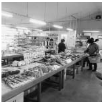
ゆ〜ゆ〜ランド農産物直売所