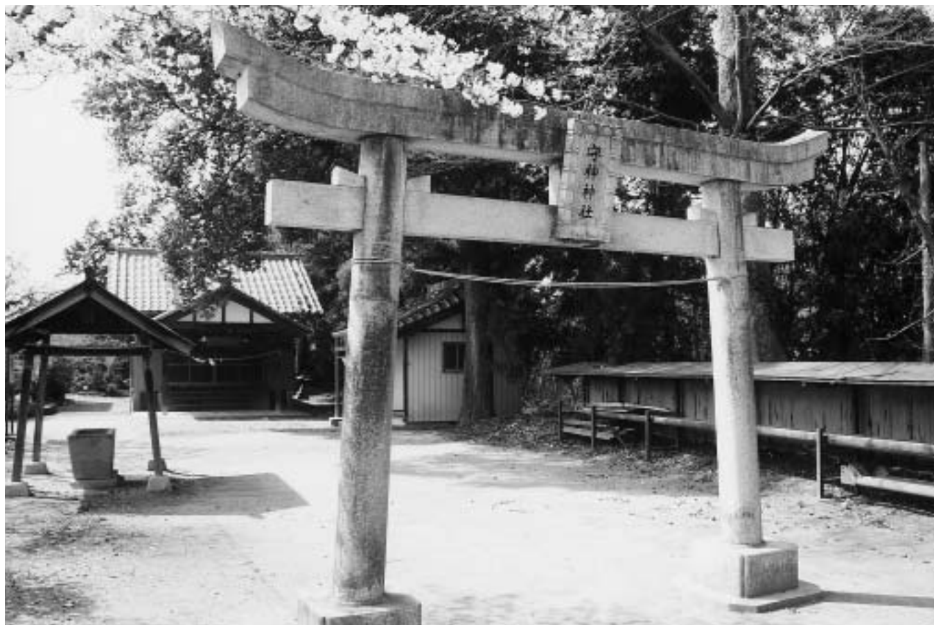
「歴史も長く・氏神・合祀…鎮守・まつりも時代とともに」池田 守神神社