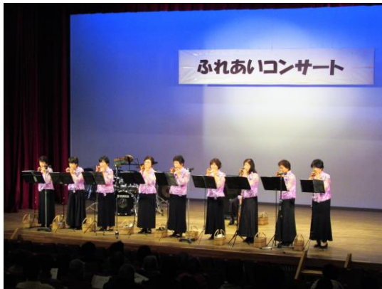
神川企画舎主催 「ふれあいコンサート」