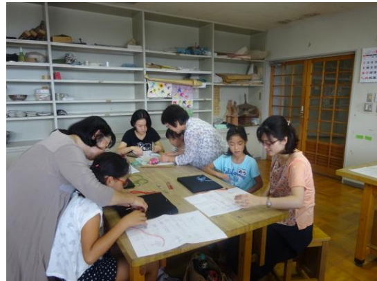
週末子ども教室 「とんぼのブローチ作り」