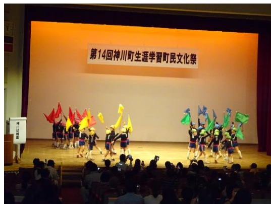
神川幼稚園 町民文化祭舞台発表