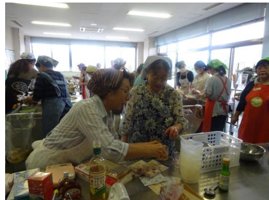
一般講座「梨のデザート作り」