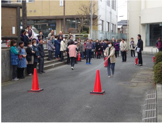
中央公民館 消防訓練