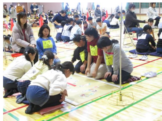
子ども会育成会事業「郷土かるた大会」