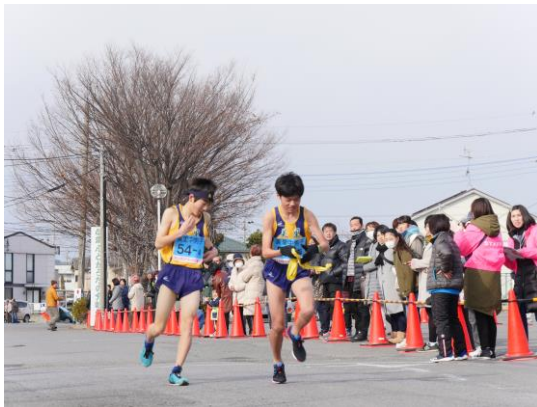
かみかわ駅伝大会