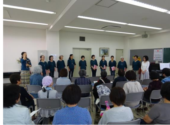
コスモスハーモニー主催 【ハーモニーの広場】