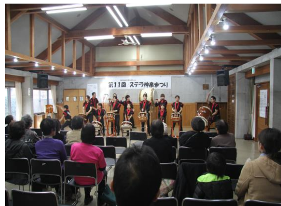
ステラ神泉まつり