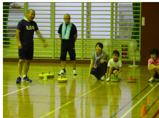
フロアカーリング教室