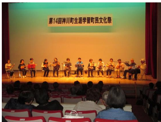
生涯学習 町民文化祭

県や近隣市町村等と連携しながら、文化に関する活動や施設等の情報提供を充実させます。