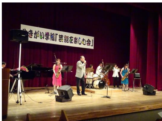
高齢者生きがい学級「芸能を楽しむ会」