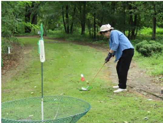
ターゲットバードゴルフ場

高齢者の多い地域では、身近でできる軽スポーツの普及を図るため、職員やボランティアが集会所等に出向く出前教室の開催を検討します。