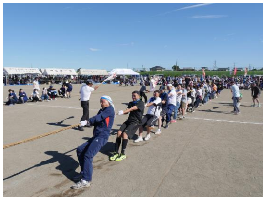
生涯学習町民体育祭

体育協会加盟団体をはじめ、スポーツ少年団及び自主活動を行っている団体等の事業の活性化を支援します。