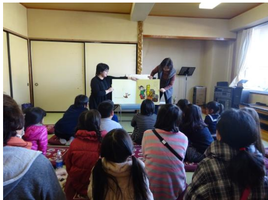
週末子ども教室「わくわくタイム」

学校開放施設としての体育館は神川中学校をはじめ丹荘・青柳・渡瀬・神泉各小学校にあり、神川中学校には柔剣道場が設置されています。グラウンドは全小中学校にあります。ナイター照明が整備されているのは中学校と丹荘・渡瀬小学校となっています。今後とも、より一層施設の有効利用を進めるとともに、利用者マナーの徹底を図りながら、広報やホームページを使いPR活動を行います。