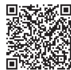
法務省ホームページ

http://www.moj.go.jp/MINJI/minji03_00051.html