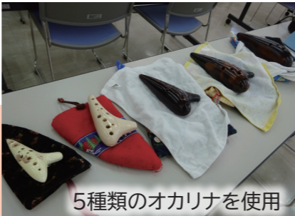
5種類のオカリナを使用

Q. 活動していく上で、楽しかったことや嬉しかったことを教えてください。 A. 全員の演奏が揃い、アンサンブルが上手くなったときは嬉しいです。また、町民文化祭などで発表することが楽しいです。