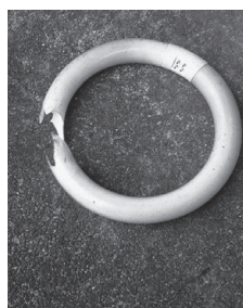
割れた蛍光ランプ (不燃物)