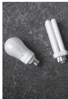
電球形蛍光ランプ