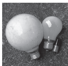
プラスチックカバー 無し 白熱電球・グロー球 (不燃物)