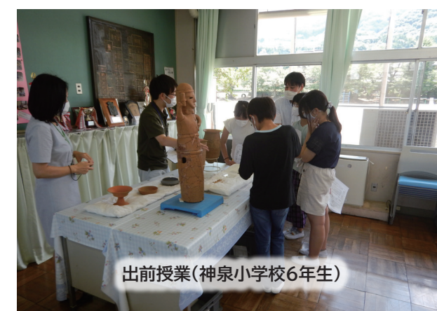
出前授業(神泉小学校6年生)