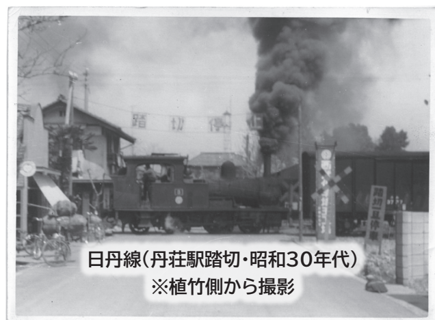
日丹線(丹荘駅踏切・昭和30年代) ※植竹側から撮影