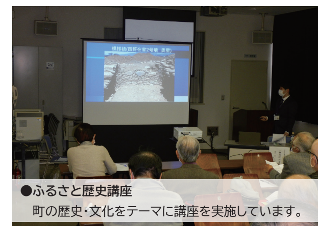
●ふるさと歴史講座 町の歴史・文化をテーマに講座を実施しています。