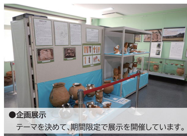
●企画展示 テーマを決めて、期間限定で展示を開催しています。

先人たちが残したバトンを未来へと繋ぐために、町の文化財について幅広い年代へ向けて伝えられるように様々な取り組みを行っていますので、機会があればぜひご参加ください。