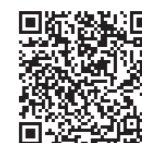
電子申請サービス