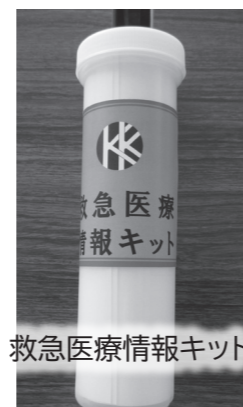
救急医療情報キット

キットがあることを救急隊員に知らせる目的として、ステッカーを玄関内側と冷蔵庫の扉に貼っていただきます。