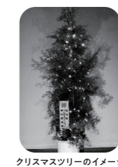
クリスマスツリーのイメージ