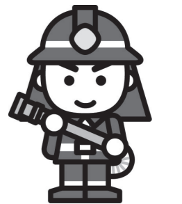
全国消防イメージキャラクター 「消太」