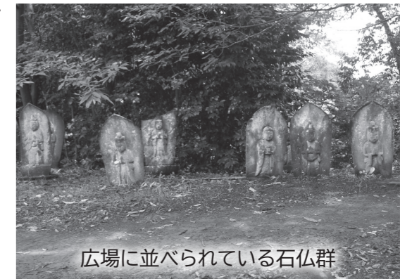
広場に並べられている石仏群

肉親を弔うためや病の快復を願ってなど、当時の人々はさまざまな理由で石仏を奉納していました。