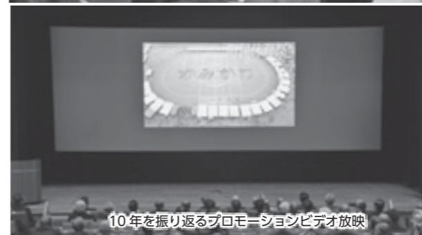
10年を振り返るプロモーションビデオ放映