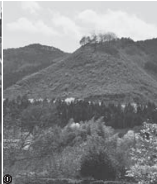
①いつも温かく見守ってくれた大神山 ②駆け付けた卒業生たち ③校章旗返納 ④教室 ⑤最後の卒業生・在校生となった5人の生徒による演奏 ⑥除幕した記念碑前で式典実行委員のみなさん