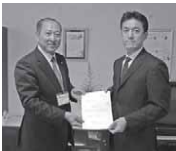
埼玉国際ゴルフ倶楽部