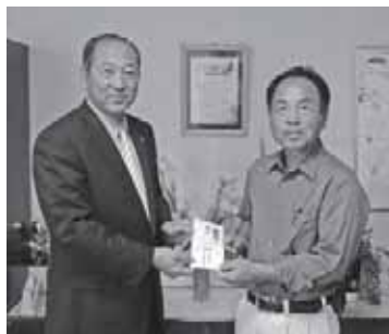
神川直売所 植木生産組合