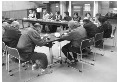
和やかな雰囲気でお弁当に舌鼓

当日の空模様は、残念ながら、雨。特別養護老人ホームいづみの庭をお借りして、桜の木の下でお弁当を広げる予定でしたが、足元が悪いため、ステラ神泉での昼食会になりました。 桜は見られませんが、皆さん和やかな雰囲気でした。