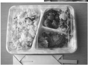
とてもおいしく出来ました